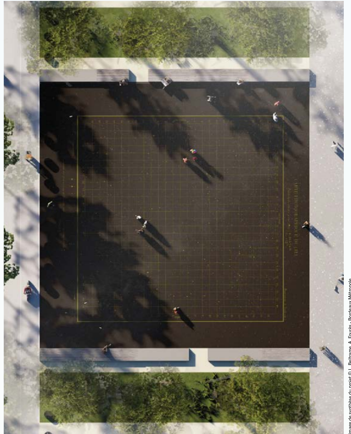
Image de synthèse du projet

Production : Les Lubies • Coproductions : Avec le soutien du Ministère de la Culture Direction régionale des Affaires culturelles de Nouvelle-Aquitain, iddac, agence culturelle du Département de la Gironde, L'Agora association culturelle de Billère, la compagnie Les Lubies