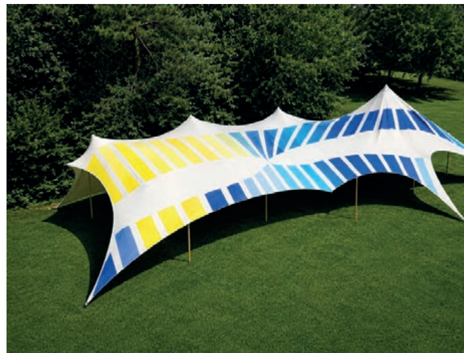
Les idées stockées / Photographie du projet non contractuelle

Coproduction et accueil en résidence : Festival Cergy Soit ! (95) • Avec les partenaires de la création initiale en 2015 : Festival Rumeurs Urbaines, Cie Le Temps de Vivre Colombes (92) ; Centre Jean Vilar - Champigny Sur Marne (94), Drac Ile de France et le soutien de la Fai-Ar et de l'Institut Français