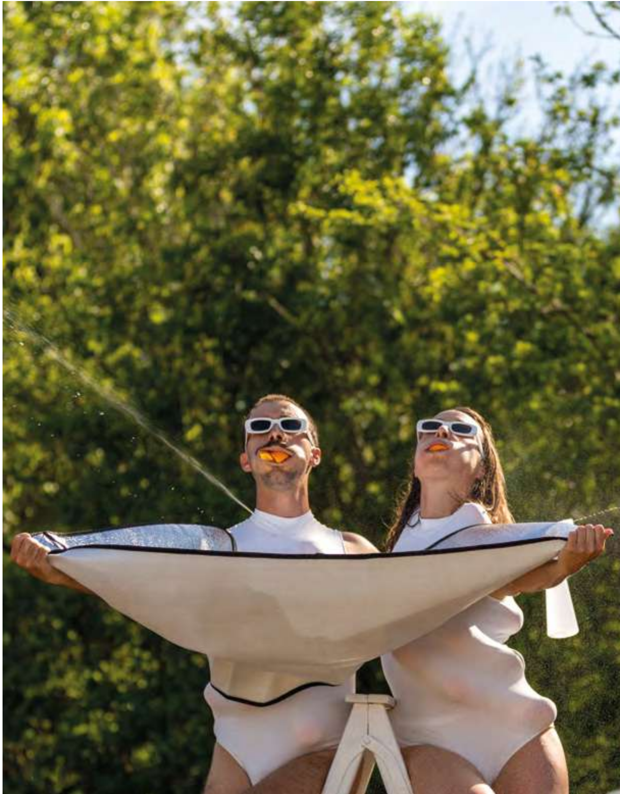
© JEU71 Collectif Comment C'est Maintenant ? - Clément Muratet & Marjorie Stoker © Charlotte Barbier

Après Julien Mouroux et Laurent Cerciat, l'artiste Lucie Bayens et ses complices ont rejoint les bords de Garonne avec Laisse un blanc , œuvre plurielle et évolutive à voir tout l'été à Saint-Louis-de-Montferrand dans le cadre du programme d'art public L'art dans la ville .